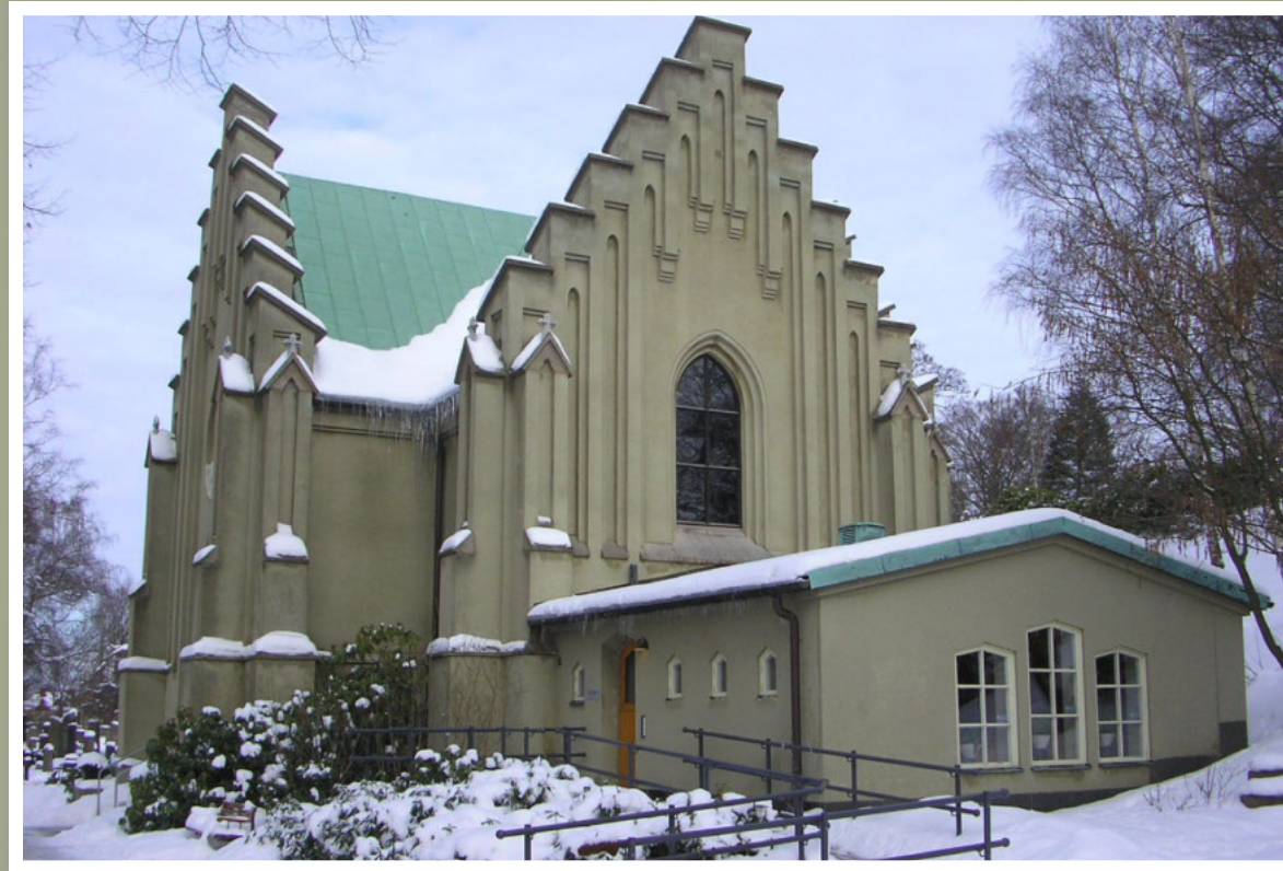
Östra kapellet - Östra Kyrkogården