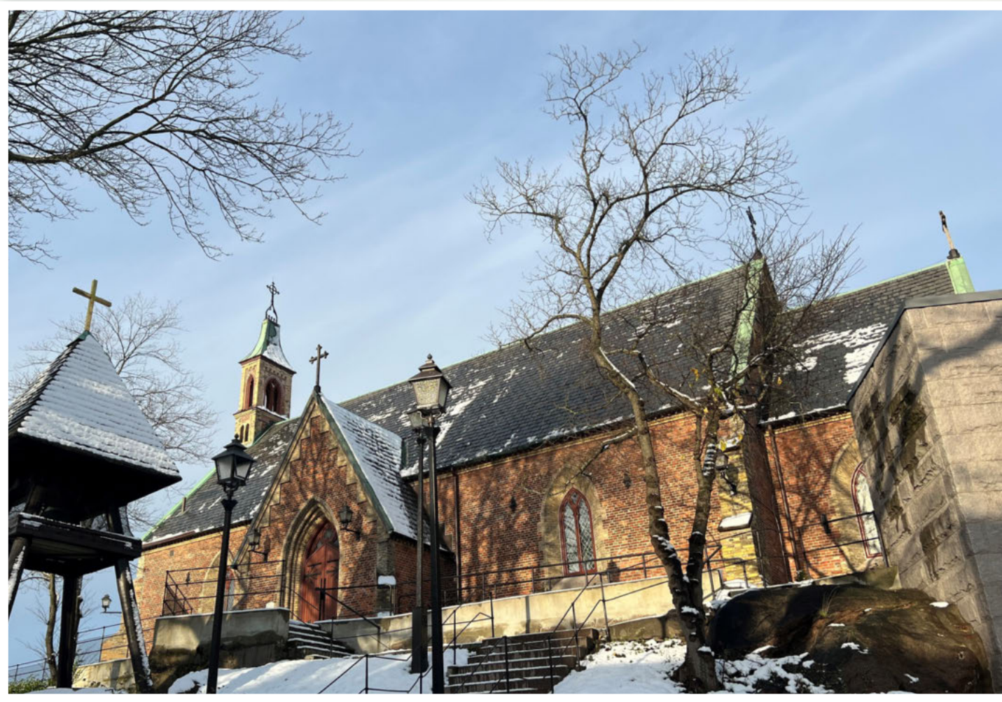
Sankta Birgittas kapell