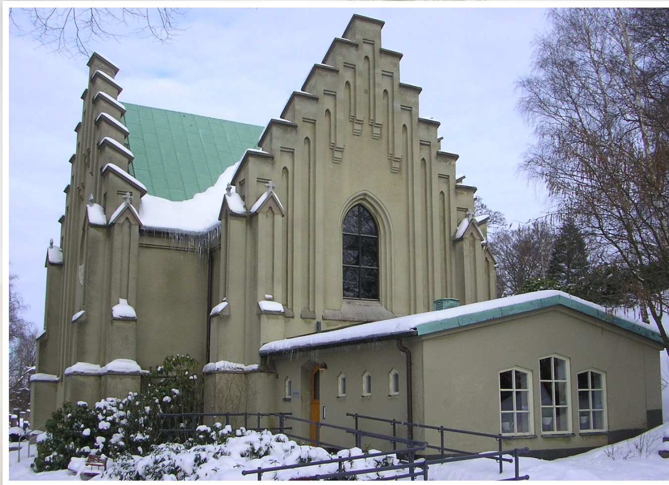
Östra kapellet, Östra kyrkogården