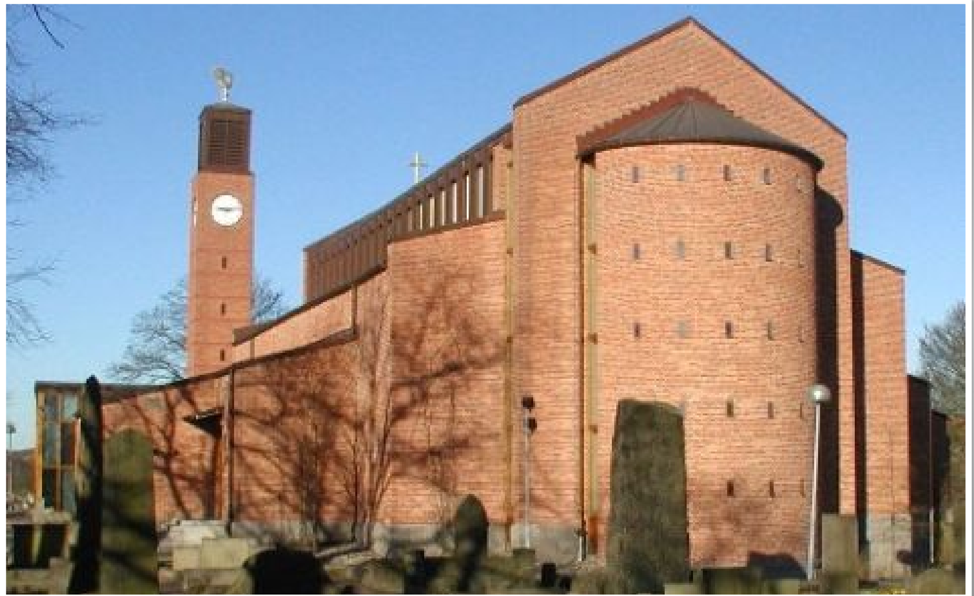
Lundby nya kyrka