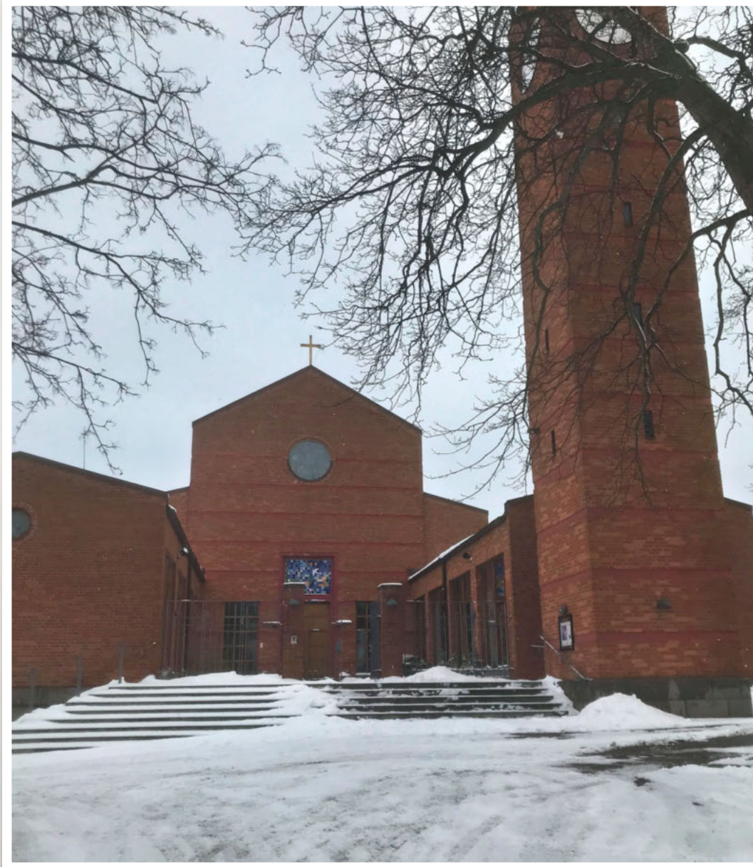
Lundby nya kyrka