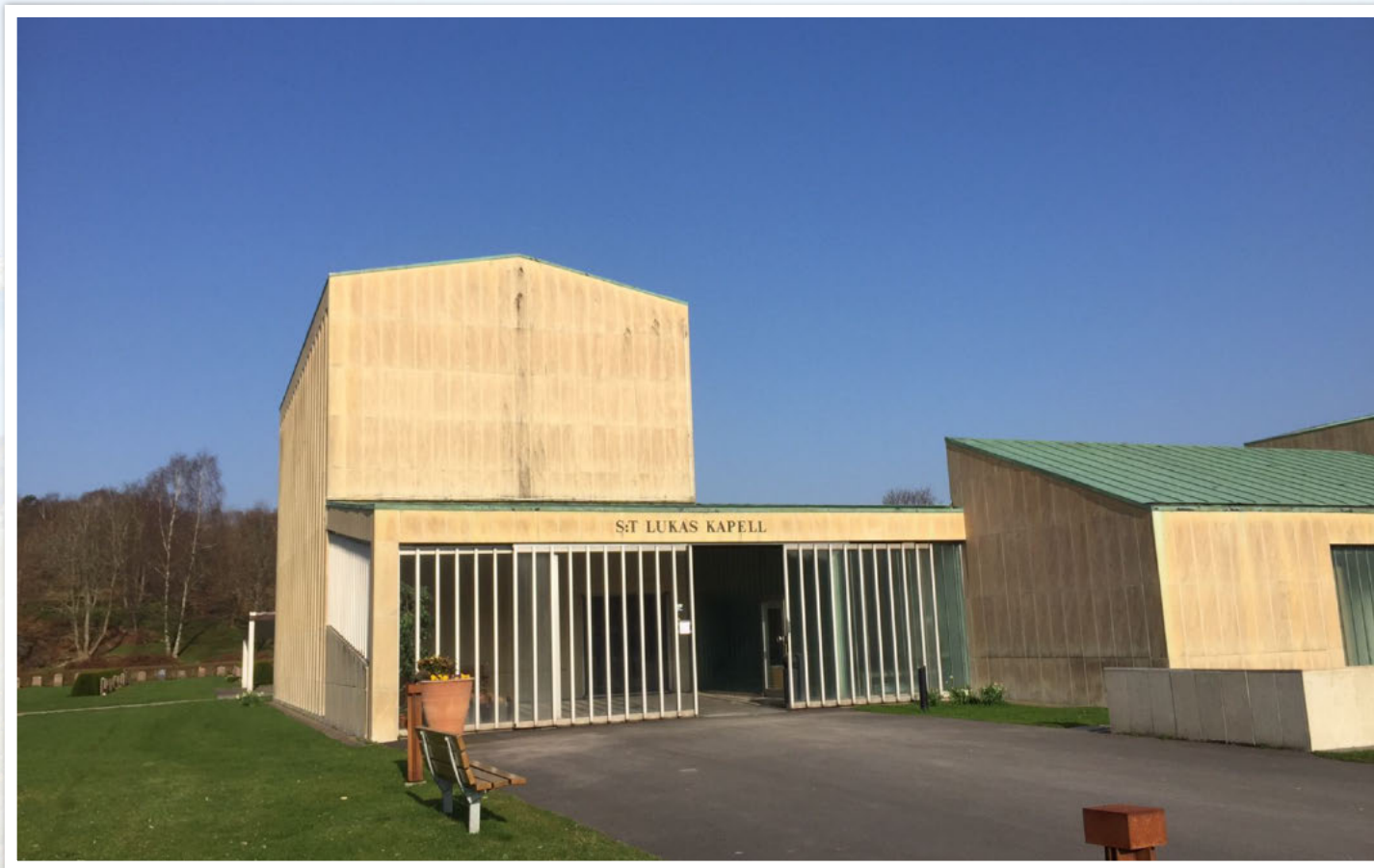
S:t Lukas kapell